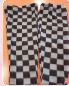
↑保護ソックス (冬バージョン) あったか素材で 保温効果 バツグンです。