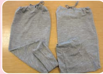
↑つま先、足の保護ソックス (春夏バージョン) 汗の臭いも吸収します。

※皆様からのご意見、ご要望にできるだけお応えし、入居者様がいきいきとした生活を送れるよう支援していきたいと思えます。ユニット担当より近況報告を行っていますので、ご家族様からの伝言も承ります。