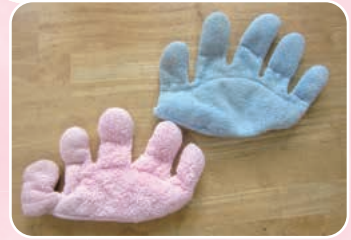
↑手枕 手指用のクッションです。