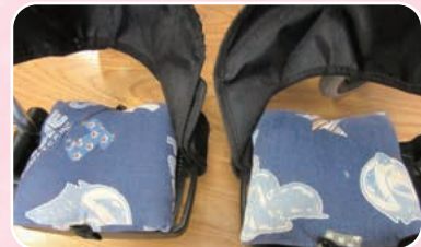
↑足用ミニクッション 履き物が履けなくても安心安全です。