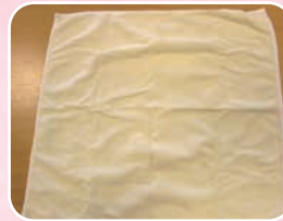
←車いす クッションカバー 防水シートを 再利用しました。