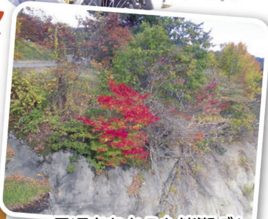
見頃をむかえた皆瀬ダム