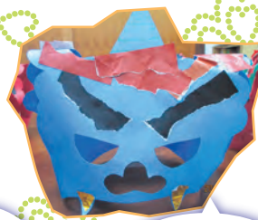
自分の中の鬼退治!!