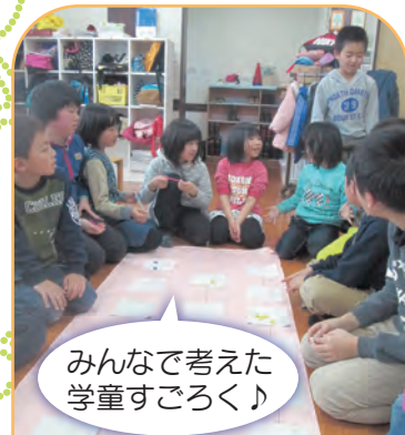
みんなで考えた学童すごろく♪