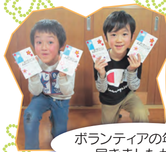
ボランティアの年賀状届きましたか!!