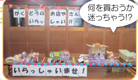
何を買おうか迷っちゃう?!