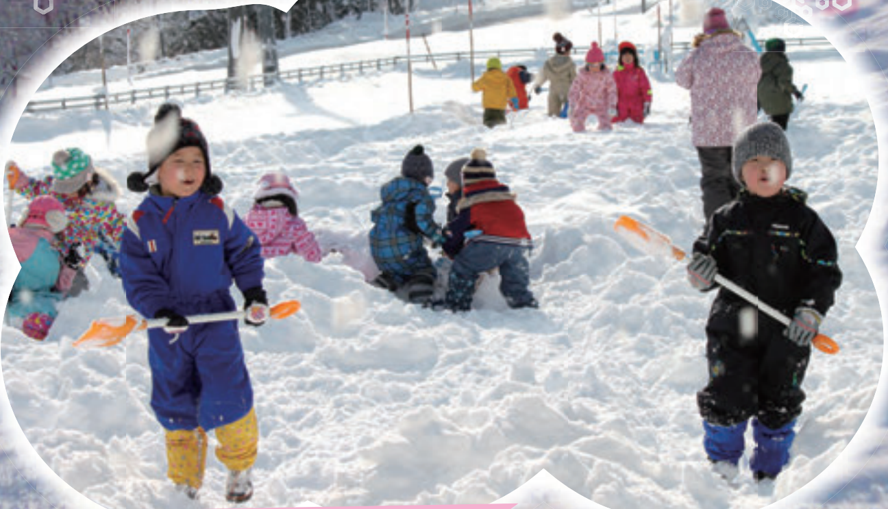
小安温泉街・栗駒山と皆瀬保育園の子どもたち