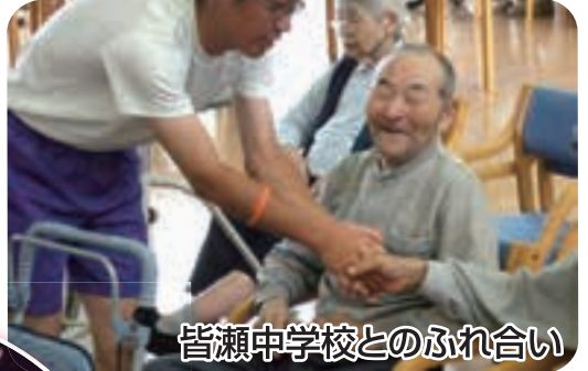
皆瀬中学校とのふれ合い