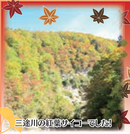
三途川の紅葉サイコーでした!