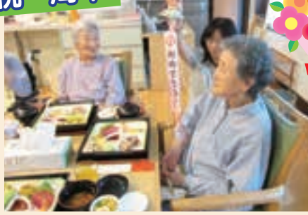
皆様に支えられ、7月1日で1年を迎えることができました。