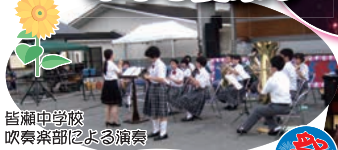
皆瀬中学校 吹奏楽部による演奏