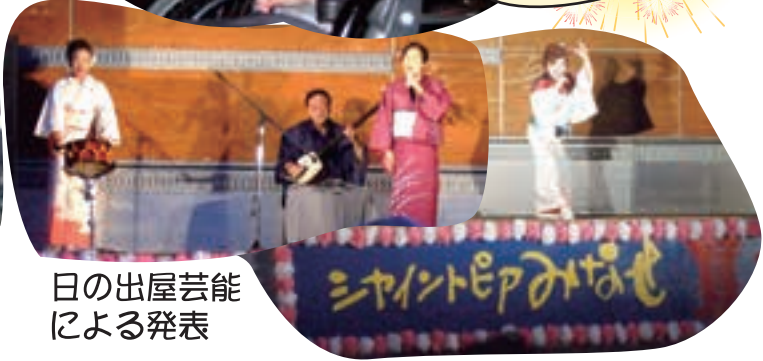
日の出屋芸能 による発表