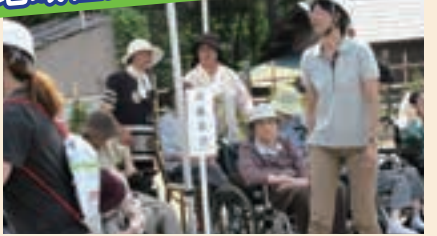
7月15日に避難訓練を行いました。地域から多数のご参加ありがとうございました。