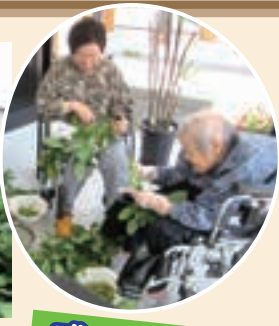
て14種類の野菜を育てて、ご利用者様と一緒に収穫しました。