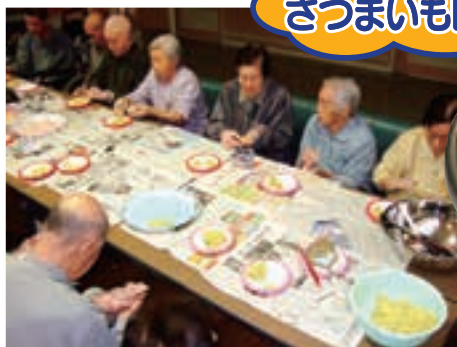
さつまいも団子作り

高松、大湯、生内方面に出かけてきました。1週間お天気に恵まれ、最高のドライブとなりました。