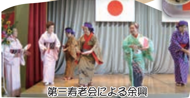
第三寿老会による余興